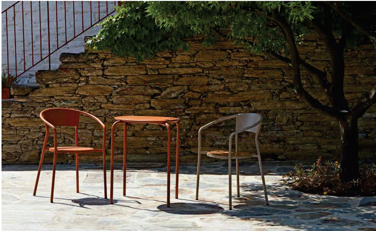
RAL: 8023 Text. | RAL: 1019 Text.

Autores. Authors: Arq. António Cayuelas Ano. Year: 2016